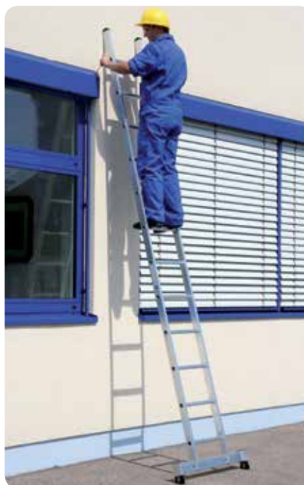
Abb. Bestell-Nr. 10312

Die nivello®-Traverse liegt lose bei und wird zweifach am unteren Holmende verschraubt.