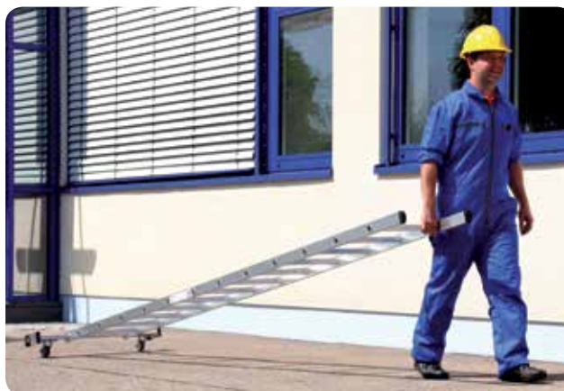
Abb. Bestell-Nr. 10512

Die 'roll-bar'-Traverse liegt lose bei und wird zweifach am unteren Holmende verschraubt.