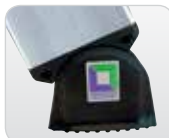
Abb. Bestell-Nr. 10010