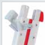
Sicherungshebel und Anlegeklotz

Achtung: Glasreinigerleitern dürfen gemäß BGI 694 aufgrund ihrer aus Gewichtsgründen knappen Dimensionierung nur mit max. 80 kg (0,8 kN) belastet werden. Alle Hymer-Glasreinigerleitern erfüllen diese Anforderung. Sie können bei voller Länge durchweg mit 100 kg (1,0 kN) und bei kürzeren Längen bis 150 kg (1,5 kN) wie übliche Leitern belastet werden. Belastbarkeit 5-teiliger Satz: max. 100 kg (1,0 kN).