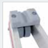
Anleggummi und Rolle am Oberteil