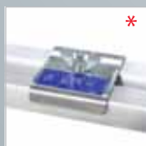
Klemmbeschlagset für Treppenstellung › Siehe Seite 159.