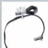
Leiterhaltersset für Dachrinnen › Siehe Seite 162.