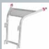
Wandabstandshalter für Sprossenleitern › Siehe Seite 162.