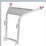
Wandabstandshalter für Sprossenleitern › Siehe Seite 162.