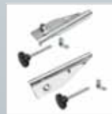
Fußspitzenset für Traversen › Siehe Seite 158.