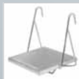
Universal-Leitertritt klappbar › Siehe Seite 160.