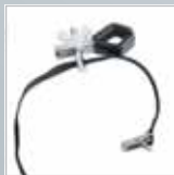
Leiterhaltersset für Dachrinnen › Siehe Seite 162.