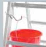
Eimerhaken für Sprossenleitern › Siehe Seite 164.