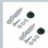
Fußspitzenset für Traversen › Siehe Seite 158.