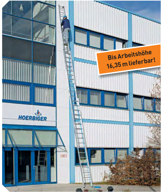
Z 600 Seilzugleiter, 3-teilig