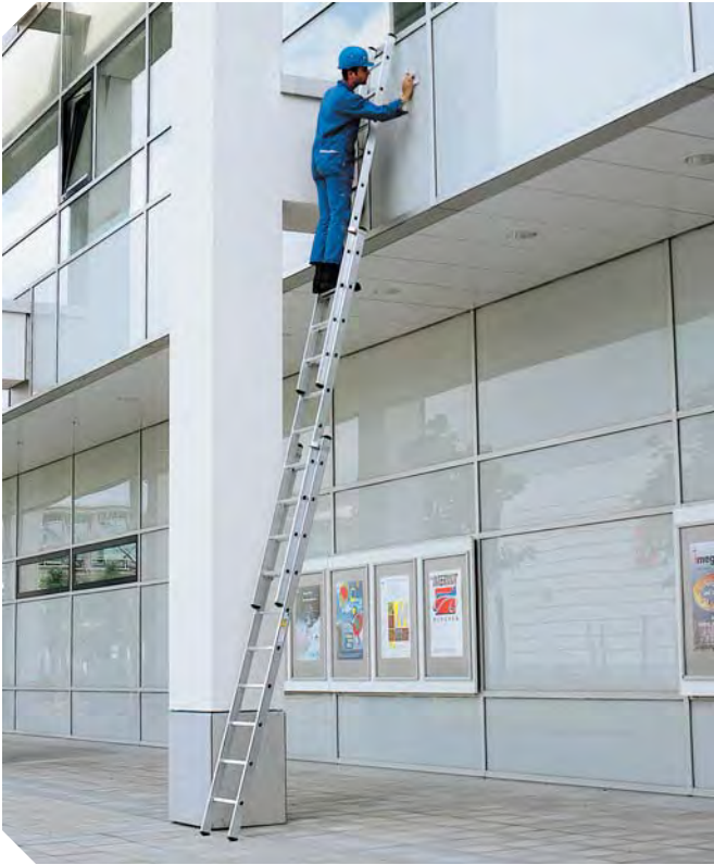
Z 600 Schiebeleiter, 3-teilig