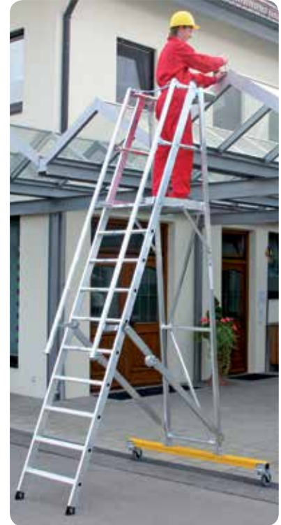
Abb. Bestell-Nr. 52310