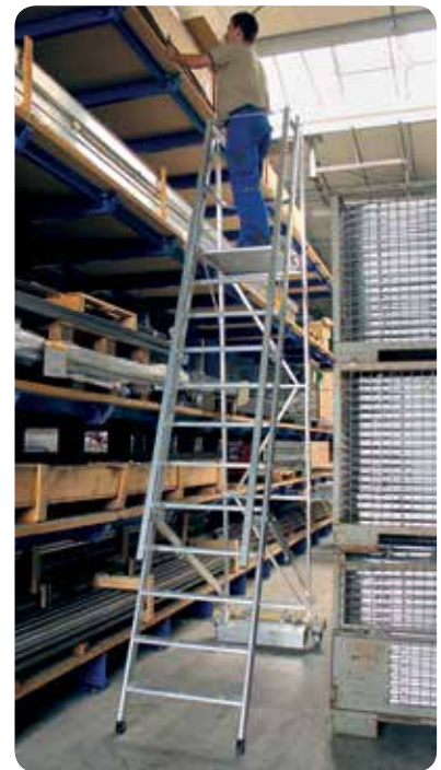
Abb. Bestell-Nr. 52712