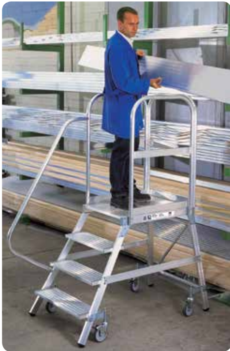
Abb. Bestell-Nr. 50104 mit Handlauf Bestell-Nr. 50109