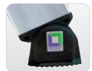
Abb. Ballastgewicht 80kg