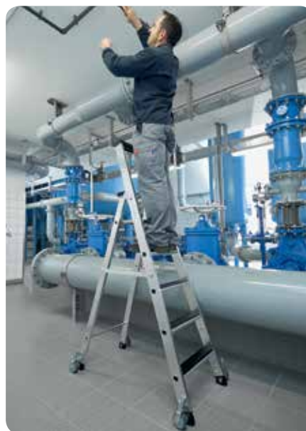
Abb. Bestell-Nr. 41905

Starre Verbindung durch beidseitig lösbare Metallstreben. Hohe Standsicherheit durch konische Bauweise. Rollen-Ø 80 mm, Stufenabstand 235 mm, Leiterneigung 20°.