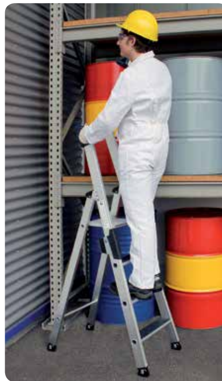
Abb. Bestell-Nr. 41504

Ab 7 Stufen Spreizsicherung mit 2 hochfesten Perlongurten. Hohe Standsicherheit durch konische Bauweise. Stufenabstand 235 mm, Leiterneigung 20°.