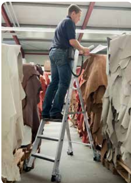
Abb. Bestell-Nr. 43105