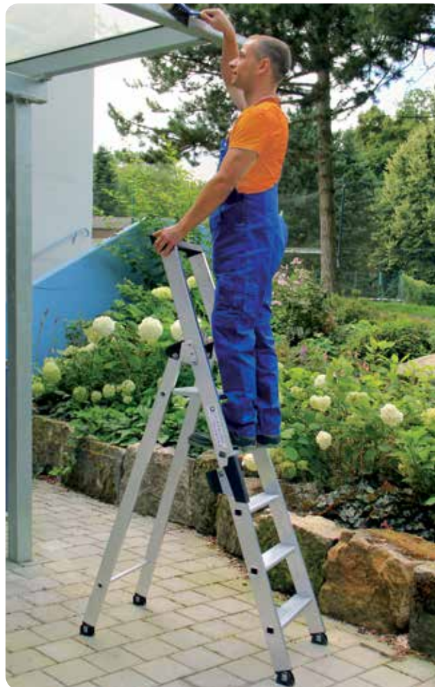
Abb. Bestell-Nr. 40105

Ab 7 Stufen Spreizsicherung mit 2 hochfesten Perlongurten. Hohe Standsicherheit durch konische Bauweise. Stufenabstand 235 mm, Leiterneigung 20°.