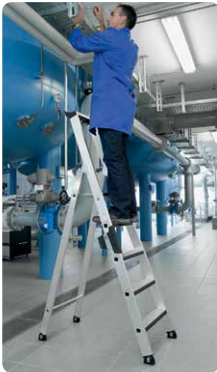
Abb. Bestell-Nr. 42105