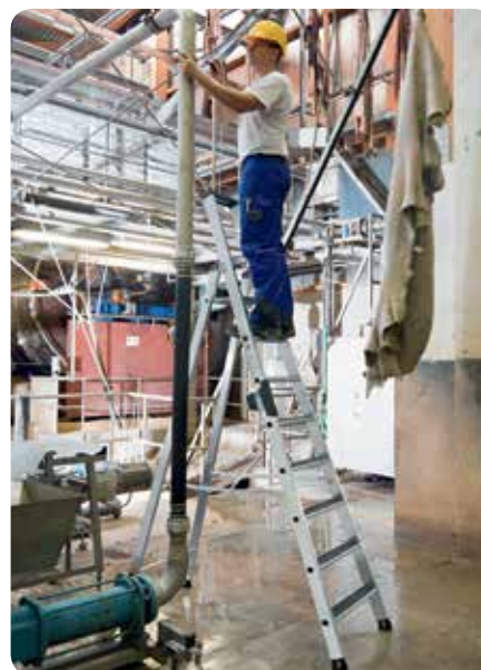
Abb. Bestell-Nr. 41628

Ab 7 Stufen Spreizsicherung mit 2 hochfesten Perlongurten. Hohe Standsicherheit durch konische Bauweise. Stufenabstand 235 mm, Leiterneigung 20°.