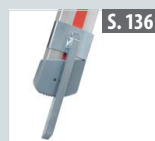
Fußspitzenset schwenkbar für Teleskopleitern