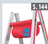
Werkzeugtasche für Aluleitern