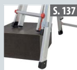
Fußverlängerung für Teleskopleitern