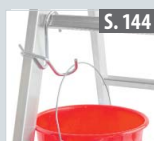
Eimerhaken für Sprossenleitern