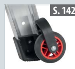
Rollenset für Teleskopleitern