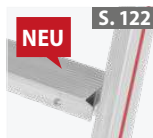
NEU Aufsetzstufenset für Glasreinigerleitern