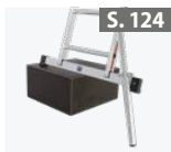
Fußverlängerung für Unterteil