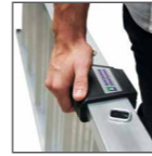
Abb. Bestell-Nr. 40612