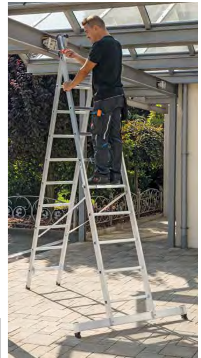
Abb. Bestell-Nr. 31220 und 19910