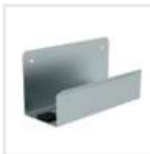
Leiterwandhalter XL Bestell-Nr. 19841