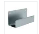
Leiterwandhalter XL Bestell-Nr. 19841