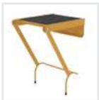
Einhängepodest R 13 Bestell-Nr. 19900