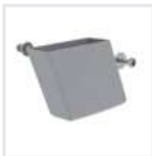
Außenschuh für Holzleiter Bestell-Nr. 19619