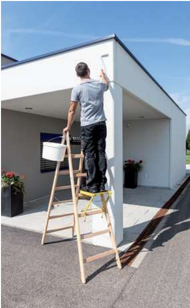
Abb. Bestell-Nr. 33214 und Bestell-Nr. 19900