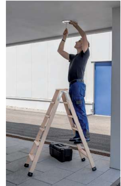
Abb. Bestell-Nr. 33812