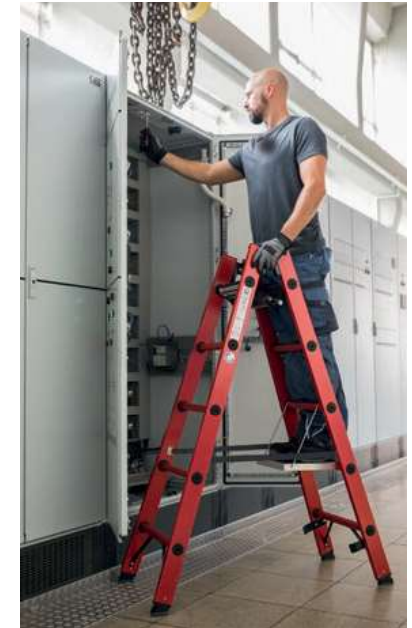
Abb. Bestell-Nr. 36405 und Bestell-Nr. 19910

Hinweis: Produkte mit GFK-Anteil sind aufgrund ihrer Sensibilität vom Umtausch ausgeschlossen