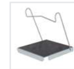
Einhängetritt R 13 Bestell-Nr. 19910