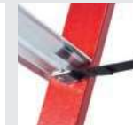
Spreizsicherung mit zwei hochfesten Perlongurten