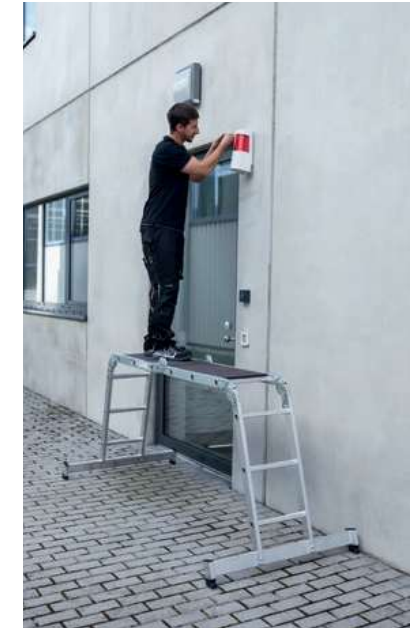
Abb. Bestell-Nr. 31322

Hinweis: Nach DIN EN 131-4 muss bei Verwendung als Arbeitsbühne eine Plattform mitbestellt werden (z. B. Holzbelag)