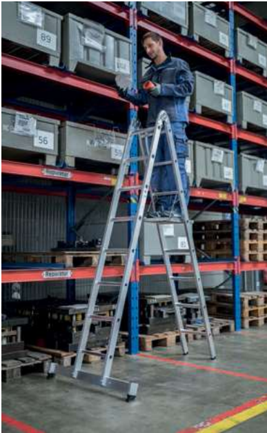
Abb. Bestell-Nr. 32216 und Bestell-Nr. 19910