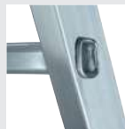
4-fach gebördelte Sprossen-/Holmverbindung