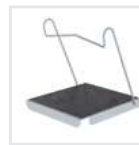
Einhängetritt R 13 Bestell-Nr. 19910