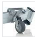
Nachrüstset 'roll-bar' Bestell-Nr. 19634