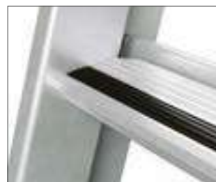
80 mm Stufe