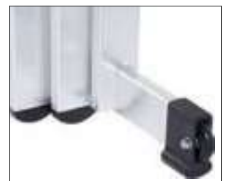
Ergonomischer Transport durch Rolle