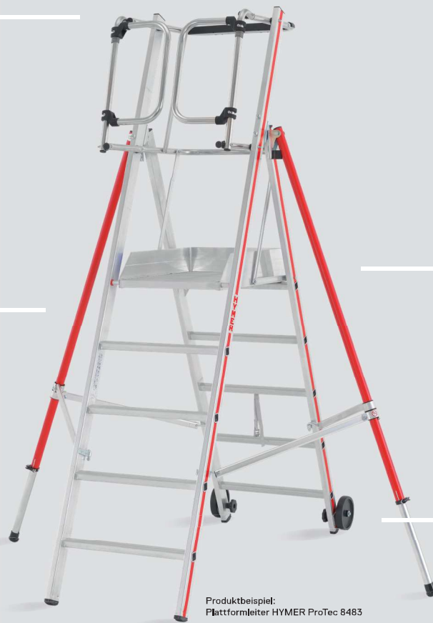
Produktbeispiel: Plattformleiter HYMER ProTec 8483

Stabiler Stand durch konische Ausführung, Traverse oder Ausleger.