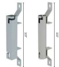
Abb. Bestell-Nr. 65005 (links) und 65002 (rechts)