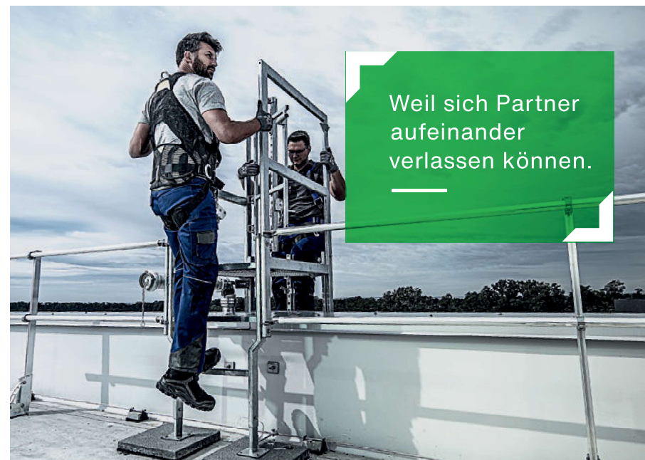
Abb. Bestell-Nr. 65008

Weil sich Partner aufeinander verlassen können.