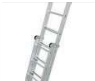
Besonders leicht durch die Kombination aus Stufen- und Sprossenleiter