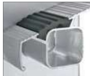
Stufe mit ZARGES Safer Step Technology