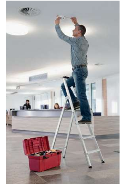
Abb. Bestell-Nr. 11224