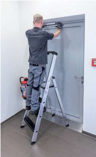
Abb. Bestell-Nr. 42104