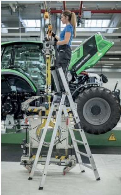
Abb. Bestell-Nr. 40106