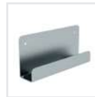
Leiterwandhalter L Bestell-Nr. 19839