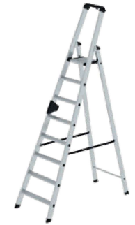
Abb. Bestell-Nr. 40108