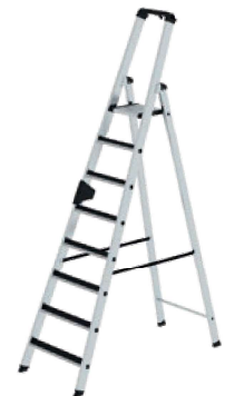
Abb. Bestell-Nr. 41628