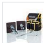
Praktische Helfer 2