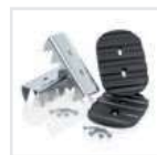
Sicherer Stand Outdoor