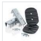
Sicherer Stand Outdoor