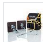
Praktische Helfer 2