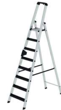
Abb. Bestell-Nr. 42108