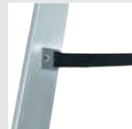
Spreizsicherung mit zwei hochfesten Perlongurten

Details auf der jeweiligen Produktseite unter www.steigtechnik.de