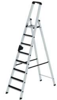
Abb. Bestell-Nr. 41508