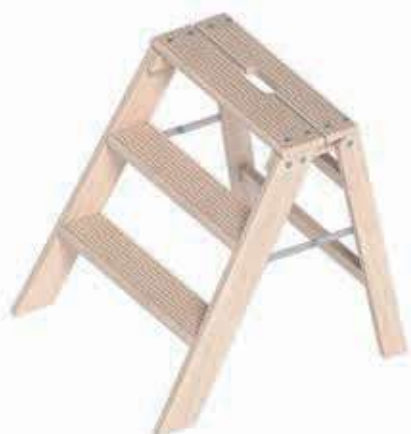
Klappbarer Holzstufentritt 1055