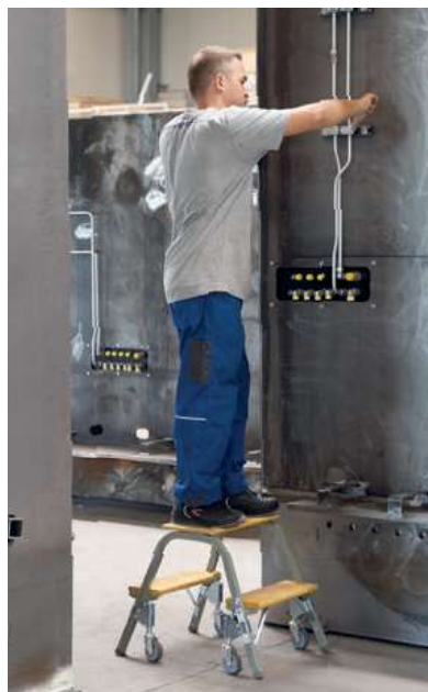
Abb. Bestell-Nr. 39022