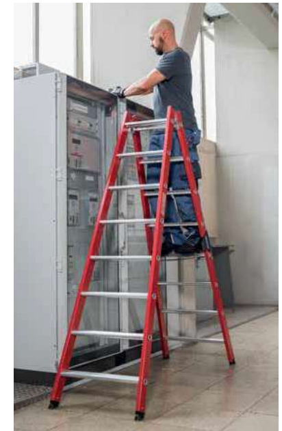
Abb. Bestell-Nr. 34116