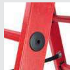
Hochfeste Sprossen-/ Holmverbindung

Details auf der jeweiligen Produktseite unter www.steigtechnik.de