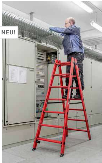
Abb. Bestell-Nr. 34214