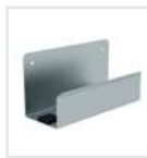
Leiterwandhalter XL Bestell-Nr. 19841