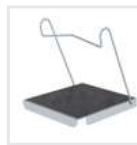
Einhängetritt R13 Bestell-Nr. 19910