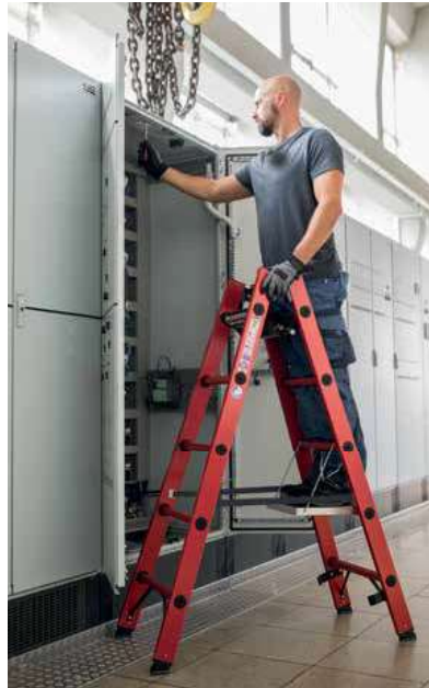
Abb. Bestell-Nr. 36405 und Bestell-Nr. 19910