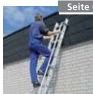
Leiterfuß (2 Stück) Nr. 4996401-4996404