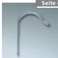
Werkzeughalter Nr. 4990000