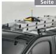
Leitersicherung (1 Paar) Nr. 4990019