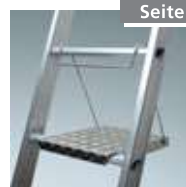
Gr. Werkzeugablage Nr. 4991041