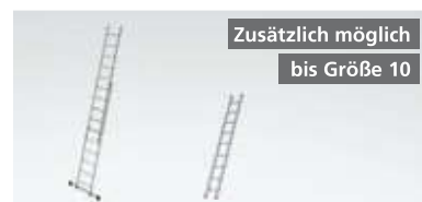
Zusätzlich möglich bis Größe 10