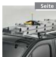
Leitersicherung (1 Paar) Nr. 4990019