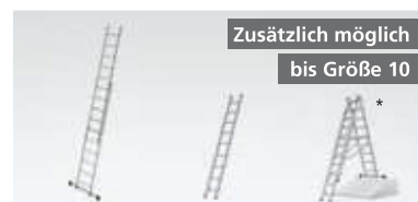
Zusätzlich möglich bis Größe 10