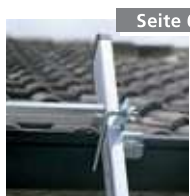
Dachrinnenhalter Nr. 4990001