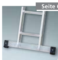
Quertraverse Nr. 4994107-4994110