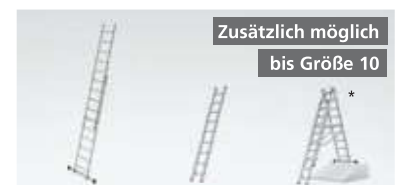
Zusätzlich möglich bis Größe 10 *