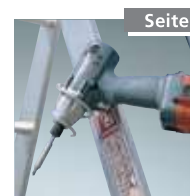
Werkzeughalter Nr. 4990000