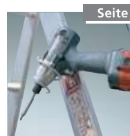
Eimerhaken Nr. 4990008