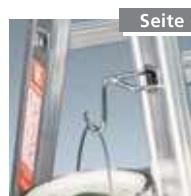
Eimerhaken Nr. 4990008