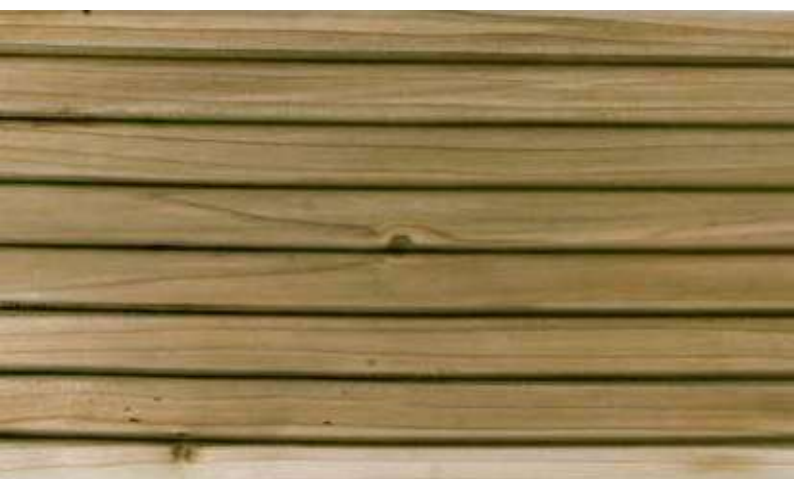
Kombiprofil 1x geriffelt | 1x genutet