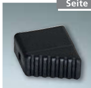
Fußkappe Steigteil Nr. 4990029