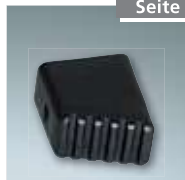
Fußkappe Stützteil Nr. 4990030