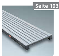
Alu Steg Nr. 8400475