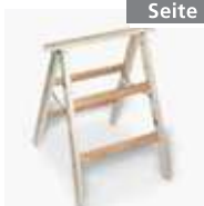
Holz-Tapezierbock Nr. 1150102