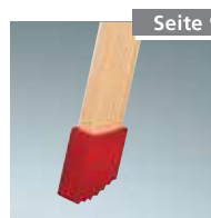
Leiternfuß rutschsicher Nr. 1990007