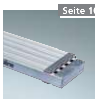
Vario-Alu-Bohle Nr. 8330000