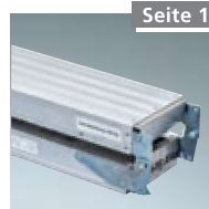
Vario-Alu-Bohle Nr. 8330000