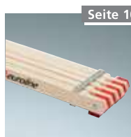
Holzbohle Nr. 1140000