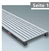
Alu Steg Nr. 8400300