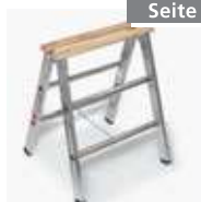
Alu-Handwerkerbock Nr. 3152102