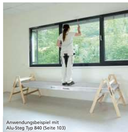
Anwendungsbeispiel mit Alu-Steg Typ 840 (Seite 103)