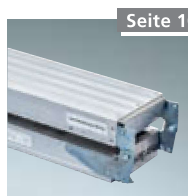
Vario-Alu-Bohle klappb. Nr. 8380000