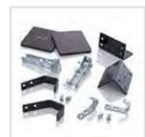
Leiterkopfsicherungen Komplett-Set Bestell-Nr. 19309