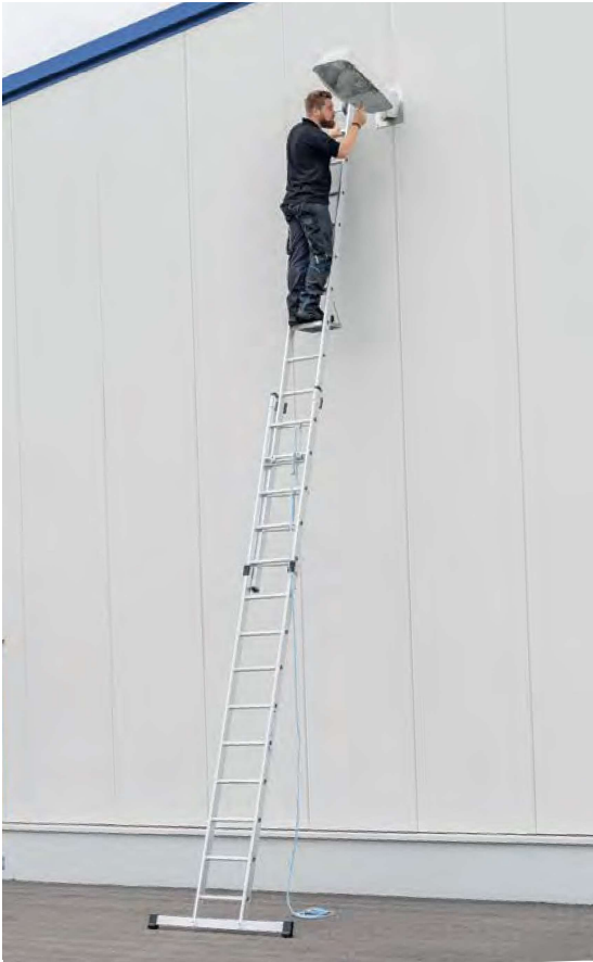
Abb. Bestell-Nr. 21714 mit Bestell-Nr. 19910