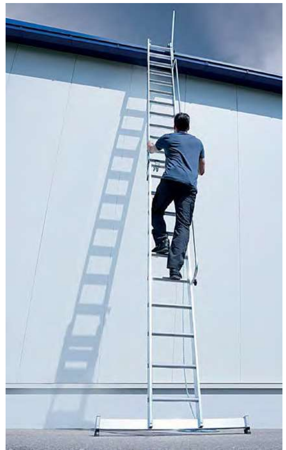
Abb. Bestell-Nr. 40695