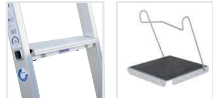
Stufenmodul MaxxStep Bestell-Nr. 19901–19905