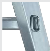
4-fach gebördelte Stufen-/ Holmverbindung

Details auf der jeweiligen Produktseite unter www.steigtechnik.de