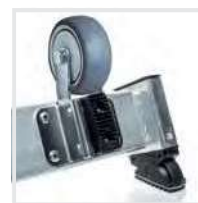
Nachrüstset "roll-fix" Bestell-Nr. 19638