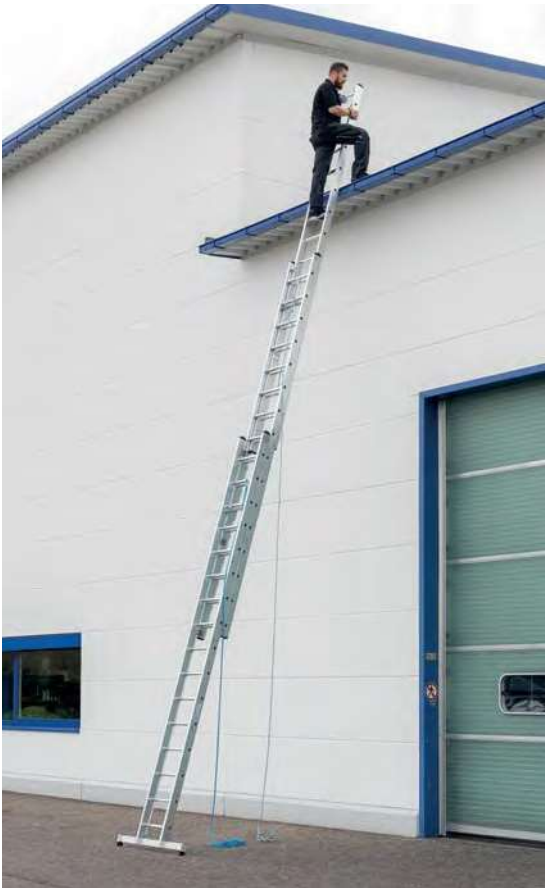
Abb. Bestell-Nr. 22416