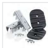
Sicherer Stand Outdoor Bestell-Nr. 19325

Neben Sets für einen sicheren Stand, gibt es auch Pakete mit praktischen Helfern oder zur Erfüllung der TRBS. Mehr ab Seite 120