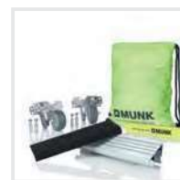
Ergonomie Bestell-Nr. 19329