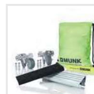
Ergonomie Bestell-Nr. 19329