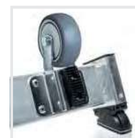
Nachrüstsatz "roll-fix" Bestell-Nr. 19638