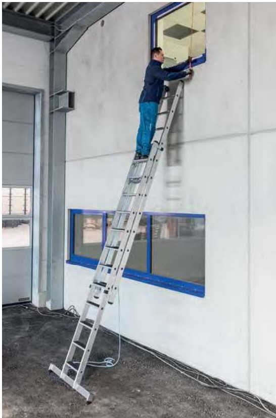
Abb. Bestell-Nr. 40694