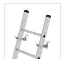
Leiterkopfsicherung Bestell-Nr. 19315, 19316, 19317

Details auf der jeweiligen Produktseite unter www.steigtechnik.de